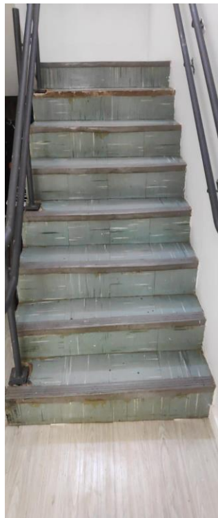
B. Fotografia do vão inferior da escada